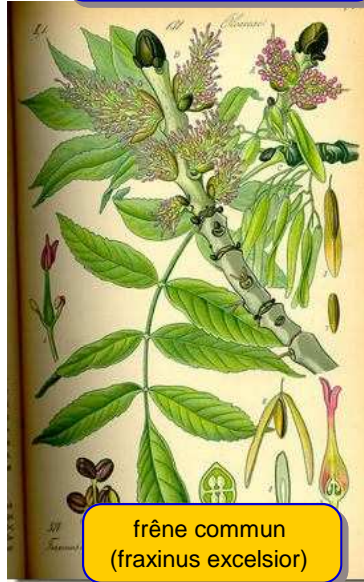
frêne commun ( fraxinus excelsior )