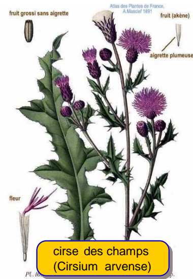
cirse des champs ( Cirsium arvense )