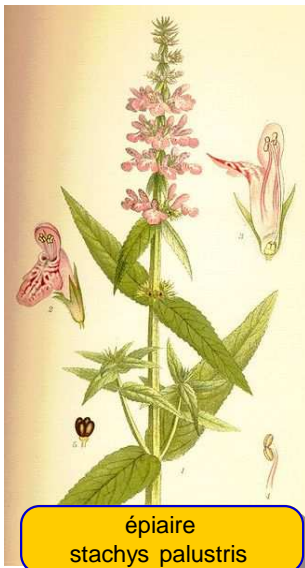
épière stachys palustris