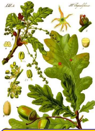
chêne pédonculé ( quercus pedunculatus )