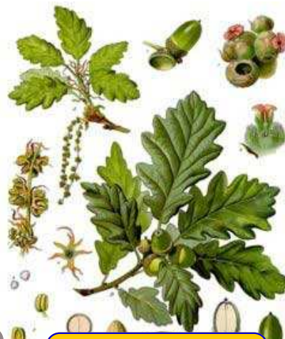
chêne rouvre ( quercus robur )