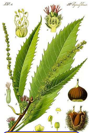
chataignier ( castanea sativa )