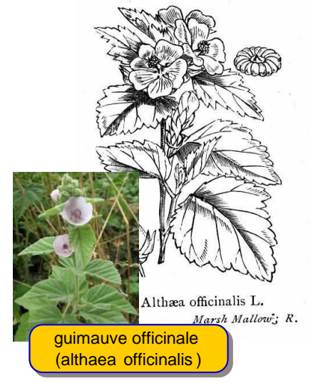
guimauve officinale ( althæa officinalis )