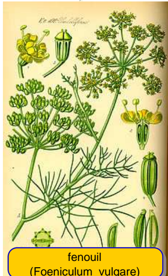
fenouil ( Foeniculum vulgare )